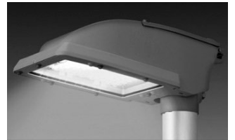
緊急対策予算により道路灯のLED化が進む

令和元年度の一般会計補正予算として 5億7,025万9千円 を増額補正し、補正後の予算額は 1,145億9,704万9千円 となりました。今回、国の国土強靱化のための3カ年緊急対策予算により、災害時の緊急用道路や避難所までの輸送道路を中心に、道路灯の LED化 への改修が進むことになりました。