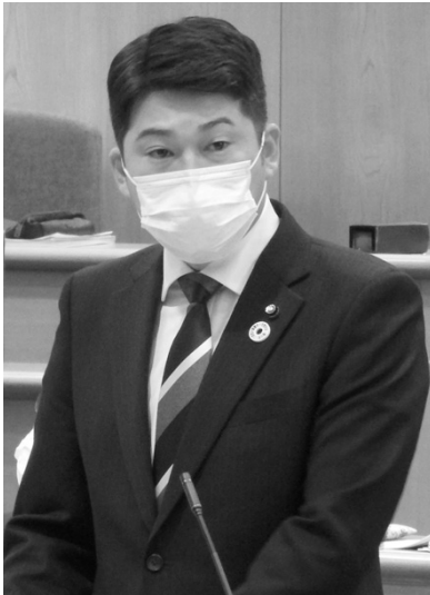
会派代表質問を行う