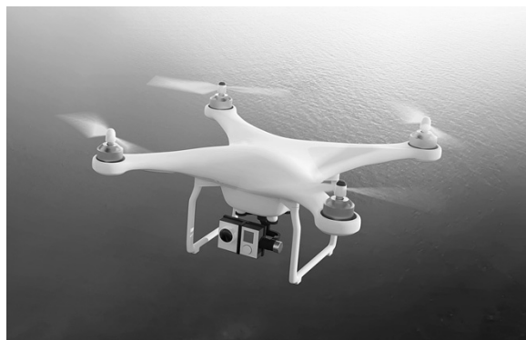
ドローン撮影イメージ

A 現在ドローン研修を受講した職員により、各総合支所地域振興課や広報課による観光誘客用のPR広報誌情報番組のための撮影など行っています。これまでの活用に加えて、レベル4により例えばスポーツ文化イベントの中継や花火・祭りなどでの警備、交通事故や海・山などの遭難事故における現場把握などでの更なるドローンの活用が考えられます。