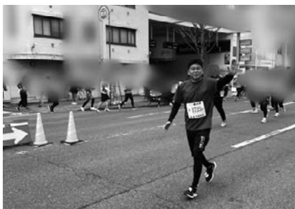
2月 津シティマラソン