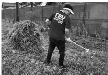
6月 スポーツ活動団体除草作業