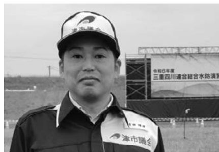
5月 三重四川連合総合水防訓練