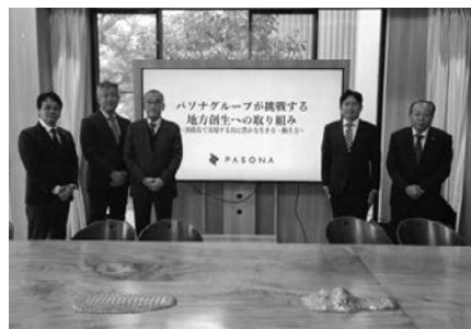
11月 地方創生の取組み視察