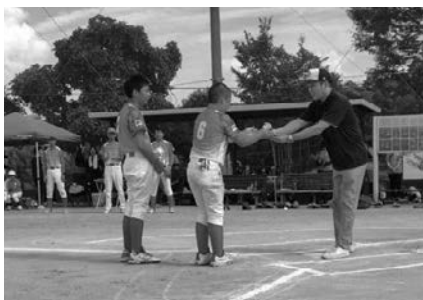
9月 学童軟式野球大会表彰式