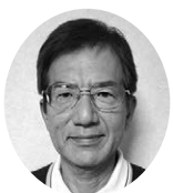
松寿会 南三重ブロック 小路代表幹事